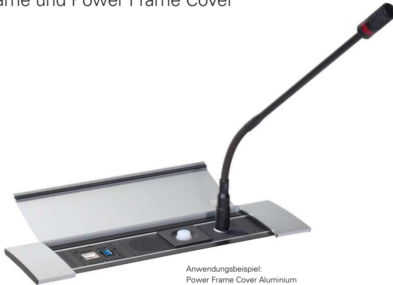
Anwendungsbeispiel: Power Frame Cover Aluminium